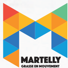
Illustration Ateliers Philippe Madec Coordinateur de la Zone d’Aménagement Concerté Martelly

L’illustration ci-dessous montre bien le rôle important que le quartier Martelly, voisin du centre historique, de la Médiathèque, du Théâtre..., joue pour la redynamisation du centre ville.