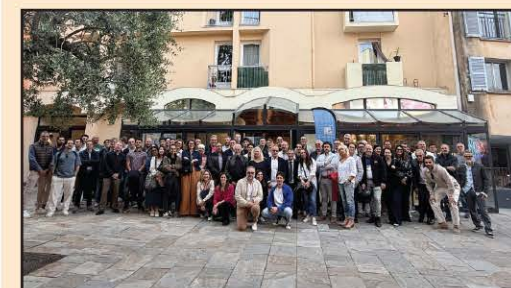
Une centaine de professionnels réunis à la Maison du Projet pour découvrir le chantier Martelly et les opportunités qu'il ouvre aux nombreux métiers de l'acte de bâtir.

Architecte, peintre, carreleur, notaire, entrepreneur, ingénieur... tous ces professionnels, membres de Cobaty (Fédération réunissant l'ensemble des corps de métiers du bâtiment) et de l'association "Villa Romée", sont animés d'une même passion, d'une même compétence et d'une même volonté de réflexion et d'action pour un objectif commun : imaginer et bâtir un meilleur cadre de vie pour les hommes et les femmes du XXIe siècle.